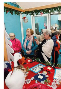
Un'iniziativa alla Brovedani